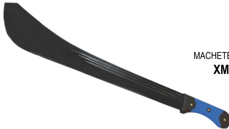
MACHETE 22' ROZADOR XMP222R