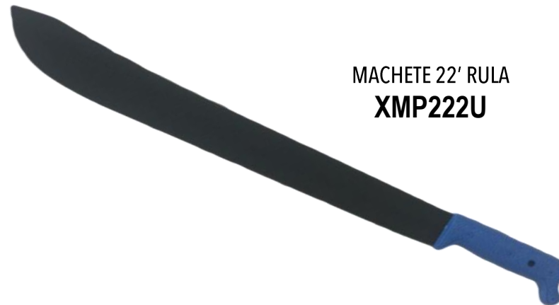
MACHETE 22' RULA XMP222U